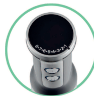
CONTROL DE VELOCIDAD