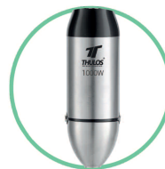
CUERPO DE ACERO INOXIDABLE